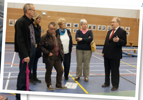
Eine Führung durch die neue Halle ließen sich viele nicht nehmen