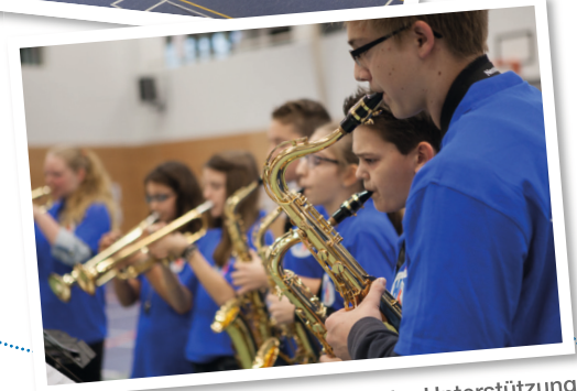
Musikalische Unterstützung durch das Orchester der Hermann Voss Realschule