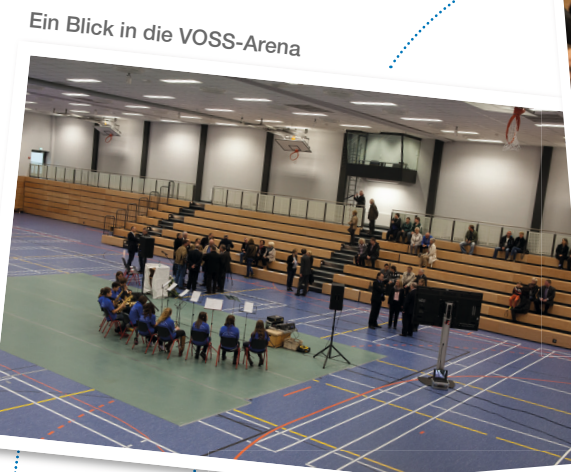
Ein Blick in die VOSS-Arena