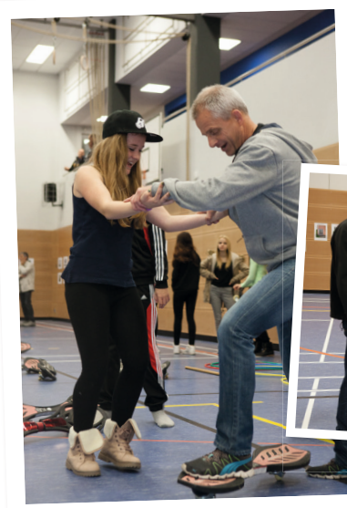
Mitmachen war angesagt